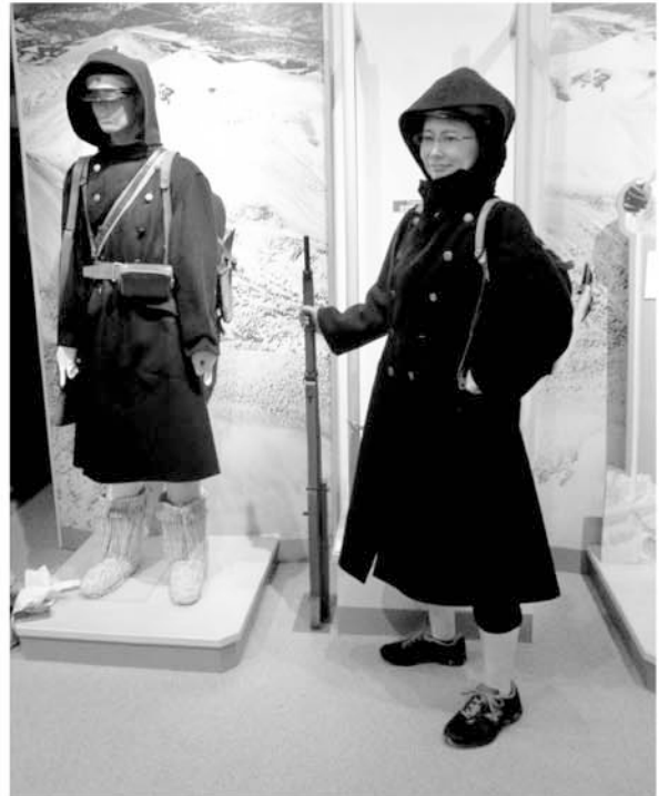
体験コーナーで友人に撮影してもらった写真

まず、③の子ども連れに対しては多くの方々が問題視していることがわかる。20年ほど博物館を利用してきて、展示を見ずに走り回ったり、大声で泣いたりしている子を見かけることは確実に増えたと感じる。博物館利用者層の低年齢化は今後も進んでいくであろう。しかし、子どもは展示室での鑑賞マナーをこれから身につけていくことが可能である。静けさが求められる美術館においても子ども向けの鑑賞教室などが積極的に行われている。この状況は今後改善していくものと思われるし、また、そうでなければならない。