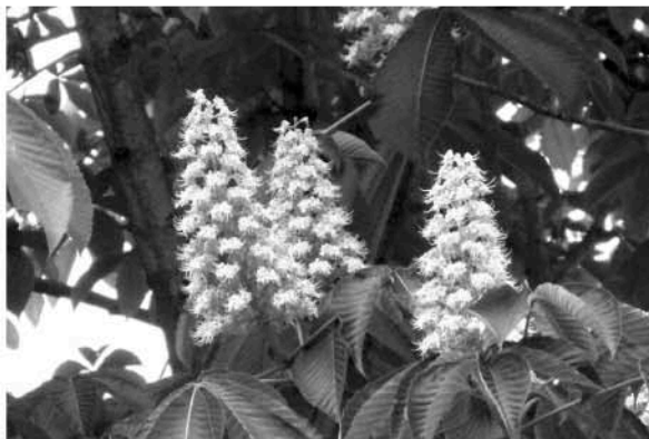
写真1：トチノキの花

トチノキ ( Aesculus turbinata ) はトチノキ科 (Hippocastanaceae) に属する落葉高木であり、東北地方では山地の溪流沿いに生育し、とくにサワグルミとともに河畔林を形成しています。生育高度によるが山形周辺では5月半ばから6月初旬にかけて枝先から穂状の花序を立ち上げ、小さく白い花をたくさん咲かせます (写真1)。トチノキを知らない方でもパリのシャンゼリゼ通りの並木として植えられているマロニエをご存知の方は