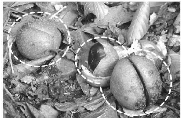
写真2：トチノキの実 (白破線内がトチノキの実および種子)

多いはず。そのマロニエはトチノキの近縁種で日本でも街路樹として植えられています。トチノキは、それぞれの花序に茶褐色の丸い果実を鈴なりにならせ、中に3つのクリの実のような種子を胎みます (写真2)。このためトチノキは別名ウマグリとも呼ばれます。大きなトチノキの種子 (以後ここでは“トチの実”と呼ぶことにします) は、クリの実 (堅果) のように大変おいしそうに見えます。しかし、渋みをもたらすタンニンに加え毒性のあるサポニンを含んでいてそのままでは食べられません。合計30日以上にわたる水さらし、湯煮、木灰汁との合わせなどの複雑なアク抜き工程を経てようやく口にすることが出来ます。ところが、“トチの実”は、東北地方の縄文時代中期末以降の遺跡から多く出土することが知られています。4000年以上前から“トチの実”はデンプン質の食料源として重要視されていた訳です。それは、“トチの実”の1粒が大きく、トチノキが