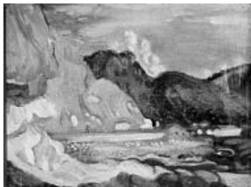
1931年 油彩 33.0cm×42.0cm

今回ご紹介させていただくのは小塚が昭和6年(1931年)に描いた《加茂港》である。絵の裏側には「昭和六年八月 湯ノ浜街道 夕景」とペン書きでの記入がある。加茂港は鶴岡市にある日本海に面した港である。画面の左側には大きくそそり立つ岸壁がどっしりとあり、手前の方から海岸に向って波が押し寄せている。画面の大部分を占