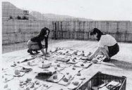
図書館屋上での曝書風景 1996年10月17日