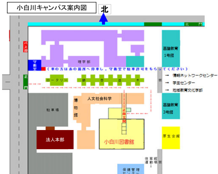
小白川キャンパス案内図