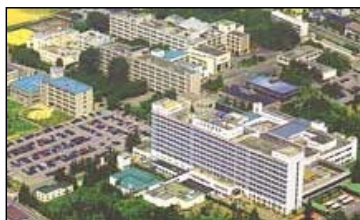
カウンター前のヒポクラテス像