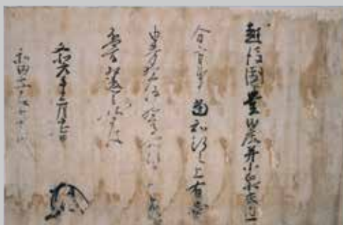
足利尊氏御判御教書(文和元年12月17日)

後醍醐天皇繪旨(建武2年6月20日) / 室町幕府執事高師直奉書(康永4年7月18日) / 足利尊氏御判御教書(文和元年12月17日) / 足利直義軍勢催促状(建武5年閏7月10日) / 大塔宮(護良親王) 令旨(元弘3年正月20日) / 尼淨智申状(付新田義貞国宣)(建武元年3月18日) 以上6点