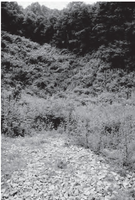
天童市ジャガラモガラ

現在では山の中に放棄され、場所の特定すら難しく、同時に、人びとの記憶からも消え去ろうとしています。本展では、山形県内の風穴、特に月山や高畠での養蚕業と風穴の結びつきに焦点をあてます。風穴を産業遺産として捉え、日本の産業振興に貢献した先人たちの知恵に想いを馳せる機会となれば幸いです。